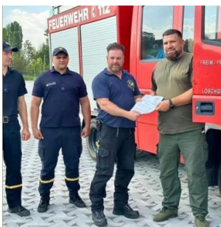
Übergabe des Feuerwehrfahrzeugs

Die Bethe-Stiftung will unsere Vereine wieder sehr großzügig unterstützen. Alle Spenden, die im Zeitraum von 01.10.2024 bis 31.12.2024 eingehen, werden bis zu einem Gesamtbetrag von 10.000 € für beide Vereine verdoppelt, wobei Einzelbeträge bei 2.000 € gedeckelt sind. Mit diesen Geldspenden beschaffen wir Medikamente, Hygieneartikel, Lebensmittel etc., um z.B. dem St.-Nicholas-Kinderkrankenhaus in Lwiw zielgerichtet zu helfen.